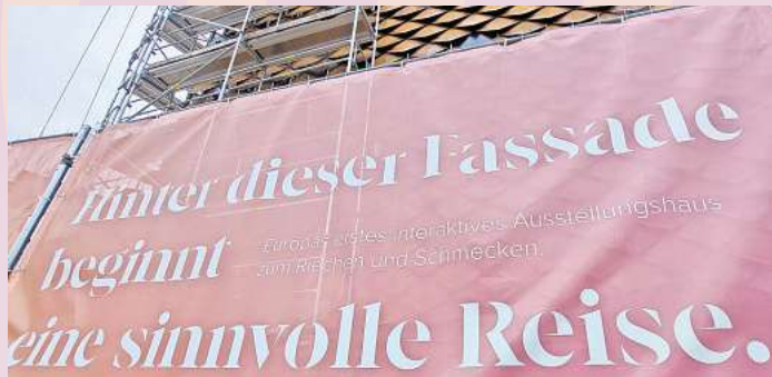
Sinn- und Werbespruch am Bauzaun vor Sensoria. THOMAS SPECHT

Programmviefalt und ermäßigter Eintritt an zwei Tagen