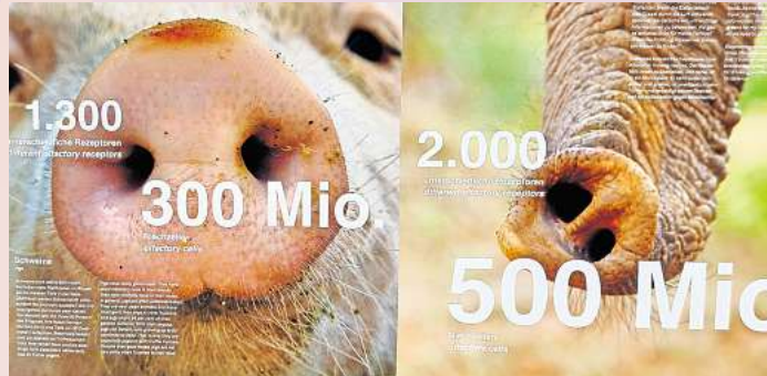
Auch in der Ausstellung: Nasen im Tierreich. THOMAS SPECHT